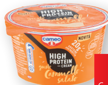
Dessert high protein caramello CAMEO gr 200 (€ al kg 7,45)