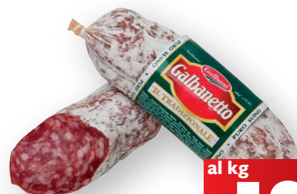
Salame galbanetto GALBANI