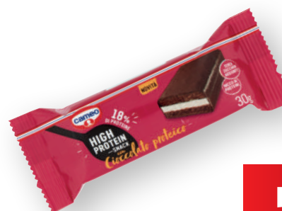
High protein snack cioccolato CAMEO gr 30 (€ al kg 33,33)