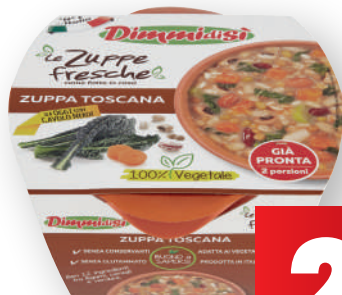
Zuppa Toscana DIMMIDISI categoria 1 a gr 620 (€ al kg 4,82)