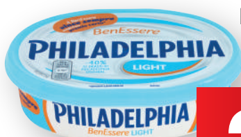
PHILADELPHIA light/yogurt greca/ active benessere gr 175 (€ al kg 12,00)