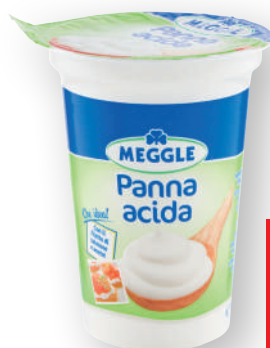
Panna acida MEGGLE ml 180 (€ al lt 7,72)