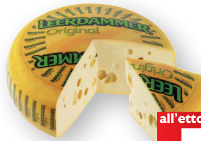
LEERDAMER (€ 10,90 al kg)