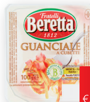
Cubetti di guanciaie BERETTA gr 100 (€ al kg 20,00)