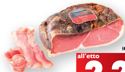
Speck WOLF (€ 22,90 al kg)