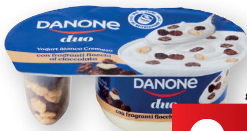
Duo DANONE assortito gr 98 (€ al kg 7,04)