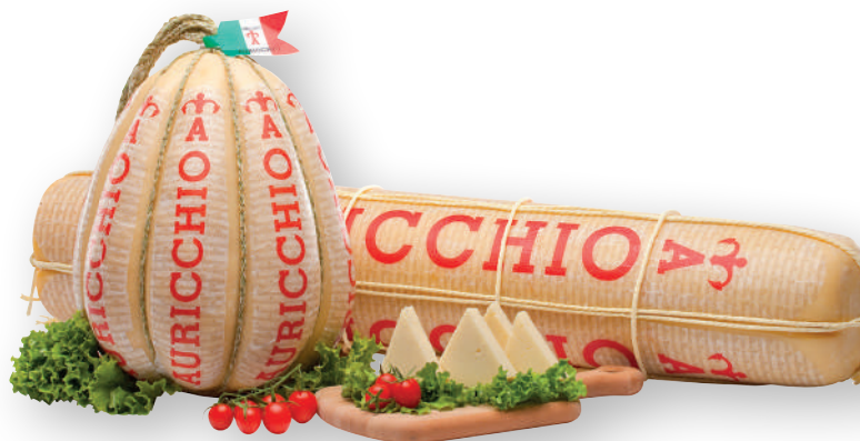
Formaggio provolone piccante AURICCHIO (€ 15,90 al kg)