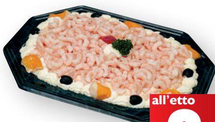
Gamberetti in salsa rosa (€ 24,90 al kg)