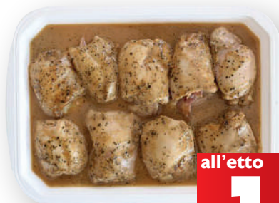
Involtini di pollo (€ 19,90 al kg)