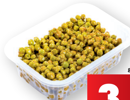
Contorno piselli gr 400 (€ al kg 9,98)