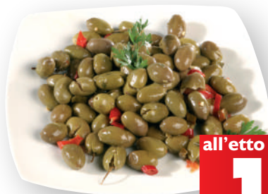
Olive cocktail (€ 12,90 al kg)